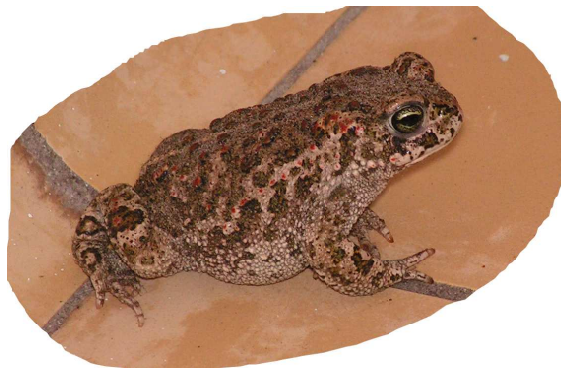
tja, een rugstreppad moet ook naar de wc

Mooi op tijd kwam het vijftal bij het ontbijt aan. En...verrassing... Anneke en Maarten!! Niet alleen dat het zo gezellig is als ze er zijn, maar ook omdat Anneke het schrijven van het verslag van mij over zou nemen.